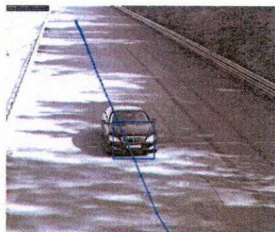
Рисунок 1 – Кадр непрерывного измерения скорости и фиксации местоположения ТС при въезде в зону контроля

Общий алгоритм работы АПК заключается в следующем: после въезда ТС в зону контроля, АПК непрерывно производит измерение его скорости и местоположения (рисунок 1) до момента выезда ТС из зоны контроля. Синхронно с измерениями производится фотографирование зоны контроля. Вычислитель АПК, по результатам измерений, определяет положение ТС на фотографиях, автоматически формирует из общей фотографии зоны контроля кадр с изображением ТС крупным планом (кадр фотофиксации), сохраняет в энергонезависимой памяти фотографию ТС и результаты измерений, в виде защищенного цифрового файла. Результат работы АПК представляет собой кадр фотофиксации с графической подписью. В графической подписи вносятся обязательные данные о результатах измерений, заводском номере ИС, дате, месте контроля, а так же могут вноситься дополнительная информация (вид нарушения ПДД, установленные пороги скорости, адрес установки ИС, направление контроля и т.д.). Кадр фотофиксации с внесенными обязательными данными представлен на рисунке 1.