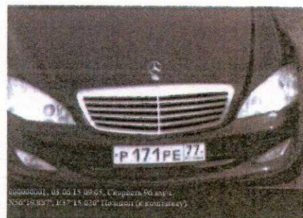
Рисунок 2 - Кадр фотофиксации, с внесенными обязательными данными о результатах измерений, заводском номере АПК, дате и месте установки